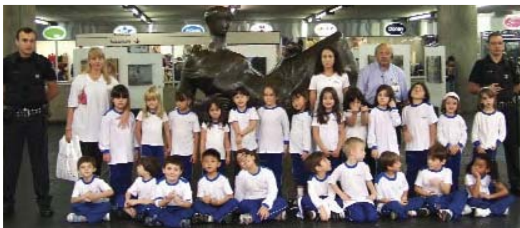
Alunos do 1º ano durante a visita: para ficar na memória.

Que criança não tem curiosidade de conhecer o funcionamento do Metrô, a circulação dos trens nos túneis e os bastidores desta operação que transporta cerca de 3,3 milhões de passageiros por dia?